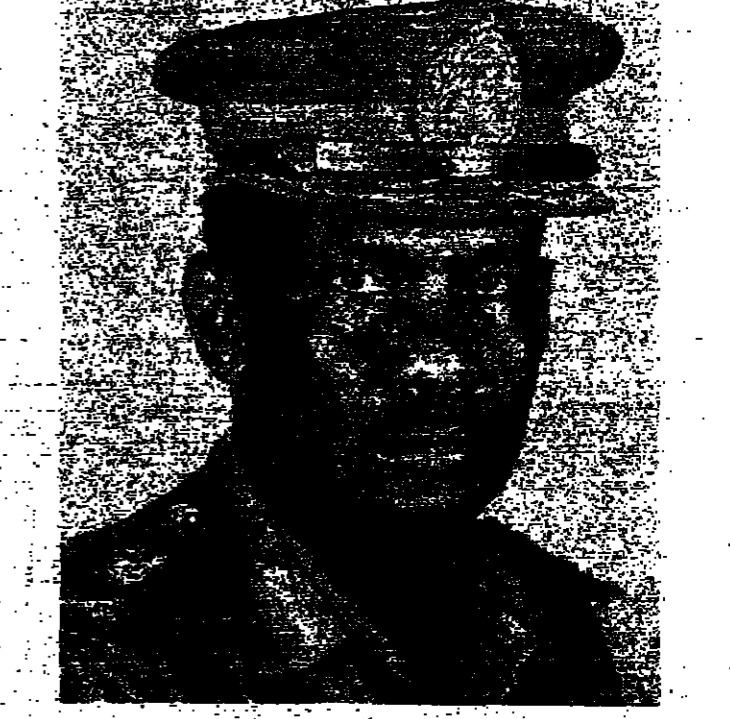
الواء محمد البشير الحيد

قال اللواء محمد البشير الحيد نائب الرئيس السوداني في بيان له: «سنضرب بيد من حديد على كل ضائن في السودان». البيان أكد على ضرورة الديمقراطية والعدالة الاجتماعية في السودان، وحث على الحوار بين جميع القوى السياسية.